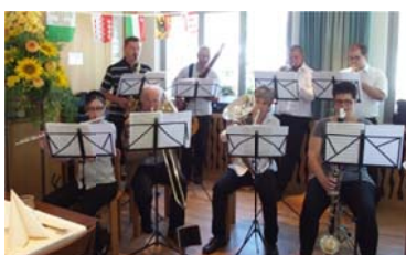
Ensemble d'instruments à vent