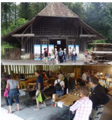
La branche "facture d'instruments de musique" se présente au Musée de l'habitat rural de Ballenberg