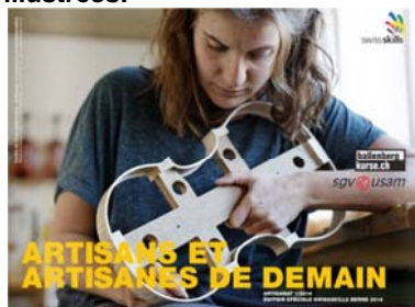
Revue « Artisans et artisanas de demain » avec le portrait de nos apprentis