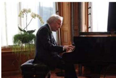
La star du piano ANDRÁS SCHIFF