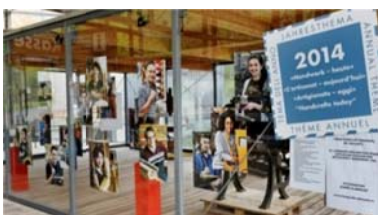
Portail d'entrée du Musée de l'habitat rural de Ballenberg avec le portrait des apprentis