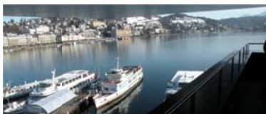
Vue du toit-terrasse