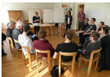
Visite du poste 3, atelier linguistique et d'apprentissage et échange de places d'apprentissage