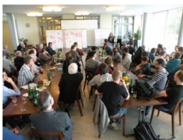
Fête de clôture avec interprétations musicales des apprenants