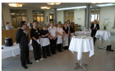
L'équipe de cuisine d'Arenenberg