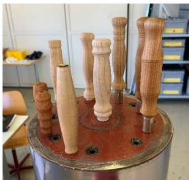
Poignées d'outils tournées et huilées CI B5