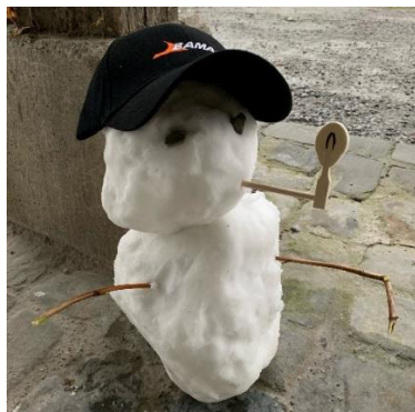
La nouvelle génération de facteurs de pianos